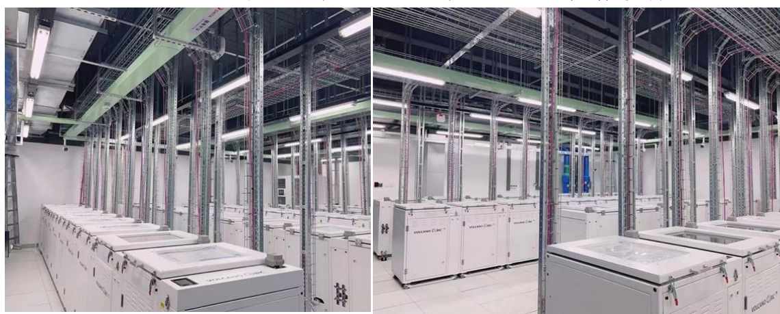
图 4：抖音-中联绿色大数据产业基地 5 号楼浸没式液冷服务器机房 三、积极应用可再生能源

抖音-中联绿色大数据产业基地 5 号楼、万国数据浦江数据中心（2 号楼）通过建立源网荷储一体化项目、购买绿电和绿证等，