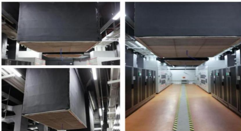
图 2: 润泽数据中心 A-18 配电室加装水冷空调及风管改造

润泽数据中心 A-18 根据节能诊断情况，先后开展冷冻一次水泵变频改造、电力室加装风管及水冷空调改造、不间断电源（UPS）从双变换运行模式改造为动态节能模式等绿色化改造，增强板式换热器换热能力，减少不间断电源（UPS）电力损耗，实现节电量约 1300 万千瓦时/年。