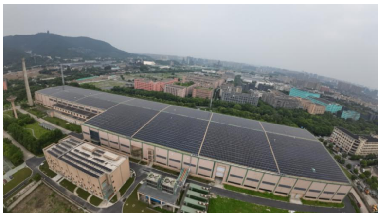
图 5：杭钢云计算数据中心屋顶光伏电站

杭钢云计算数据中心（东区）利用 34000 平米的主厂房和辅助设施厂房屋顶建设分布式光伏电站，总装机容量约 6 兆瓦，年发电量 600 余万千瓦时，占机房总用电量的 10%。