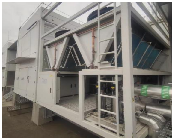
图 7: 抖音-中联绿色大数据产业基地 5 号楼热回收机组

抖音-中联绿色大数据产业基地 5 号楼在预制一体式氟泵空调机组的风冷冷凝器上安装水-氟换热器制取热水，用于满足数据中心运维办公区、设备用房、门厅、走廊等区域冬季供暖及防冻需求。