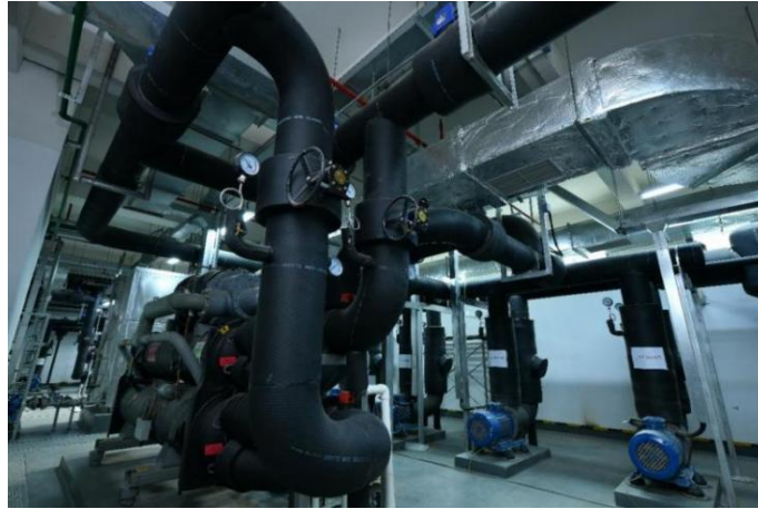
图 6: 万国数据浦江数据中心（2 号楼）水环热泵余热回收系统

抖音-中联绿色大数据产业基地 5 号楼在预制一体式氟泵空调机组的风冷冷凝器上安装水-氟换热器制取热水，用于满足数据中心运维办公区、设备用房、门厅、走廊等区域冬季供暖及防冻需求。