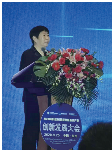
参加 2020 年中国（抚州）智慧商显系统产业创新发展大会

改革开放初期，人们都觉得外国的东西好，而再看当今，现在年轻人更追求“国潮”，这从另一个方面再次印证了国民对祖国的自信，对于中国制造的自信。可以说只有国家发展了，行业进步了，才能让老百姓信服并接受中国制造，就不会再去追求“洋产品”、“洋品牌”，因为我们制造的产品更优秀。这是一个非常大的变化，没有改革开放，就没有中国的今天。所以说现在中国各个方面、各个行业取得的成就都不是一蹴而就的，都是通过中国人民一步一步脚踏实地，历经一代又一代人辛苦奋斗出来的。从当年国家出口的“老三样”到今天出口的“新三样”，工业作为一个国家的“脊梁”，中国人的脊梁终于挺起来了。