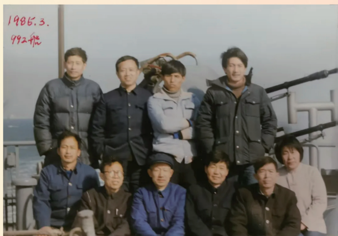
《声呐技术攻关承包小组》 西北工业大学 赵俊渭 拍摄于1985年3月20日