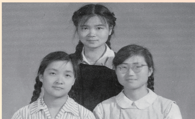
《50年代年轻人的革命友谊》 北京理工大学 恽雪如 拍摄于1955年