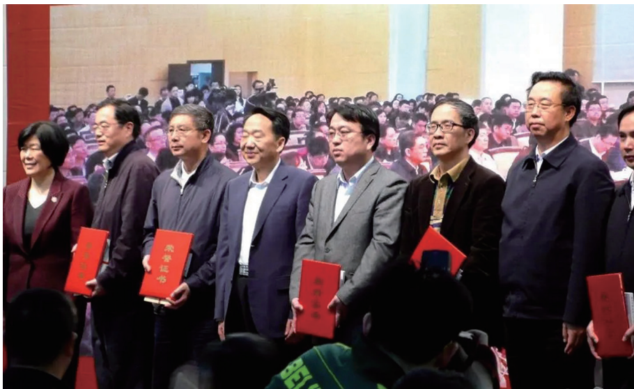
2014年4月24日在读书活动现场，我（左三）接受蒋建国副局长（左四）颁发“十佳听众”荣誉证书

见，都让我在笔记本上密密麻麻记满批注，至今仍不时翻阅回味。当时，我还写下不少现场感言留给组织者。为此，在2014年4月中央国家机关正式开展“强素质 做表率”读书活动五周年之际，我被中央国家机关工委评为“十佳听众”。2014年4月26日在“强素质 做表率”读书活动现场，我与其他九名读者听众，接受了时任国家新闻出版和广电总局党组副书记、副局长蒋建国等领导颁发的荣誉证书。