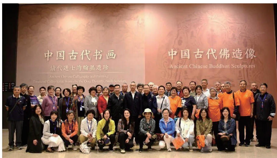
四家单位老年大学书法班学员活动合影

为进一步丰富教学形式，提升教学效果，4月29日上午，工业和信息化部老年大学万寿路校区组织书法班近20名学员与来自中央和国家机关工委、海关总署、国家税务总局等单位老年大学书法班学员一道，赴国家博物馆参观“中国古代书画—清代进士的翰墨遗珍”展览。