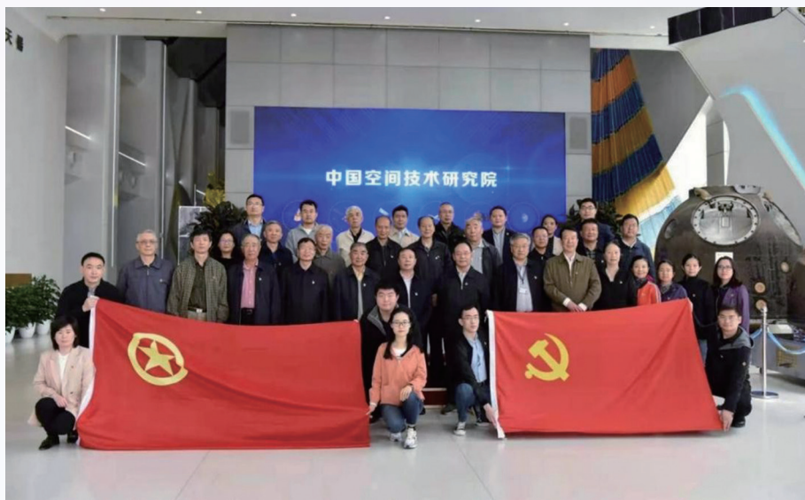
第 17 党支部与局团支部联合开展“党团共建”主题党日活动

期交流的模式强化了老同志的思想政治建设。同时支部也注重创新形式，带领党员“走出去”，通过现场观摩引导党员坚定政治信仰。支部与局青年干部联合开展“党团共建”主题党日活动，赴中国空间技术研究院参观，学习中国航天精神，青老携手，传承红色基因感悟中国共产党人的精神谱系。